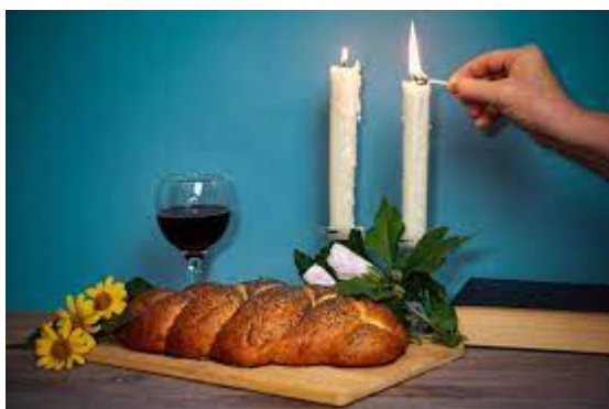
Masa de Șabat

„Iar tu, vorbește copiilor lui Israel spunând: Dar, Șabaturile Mele să le păstrați” (Exod 31:13)