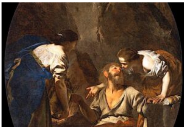
Preoții la munca lor în Templu și dascălii de halacha (legi evreiești)